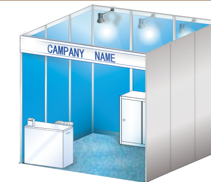
ベーシックプラン (1ブース) イメージ図

※2ブース以上のプランもございます。 ※個別装飾や備品レンタルのご提案についても事務局にご相談ください。 ※本装飾プランは必須ではありません。装飾は各社で行っていただいで結構です。